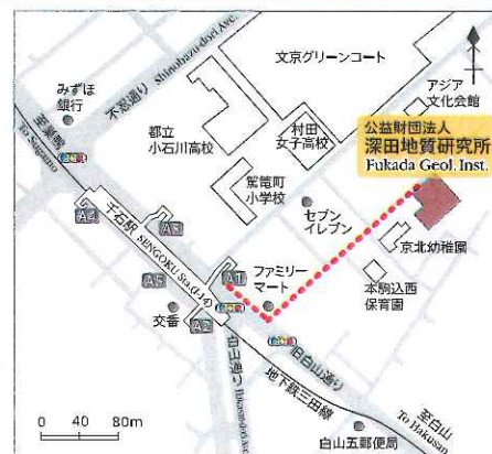
都営地下鉄三田線千石駅下車A1出口より徒歩3分