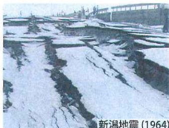
新潟地震 (1964)

文京区周辺の地震防災、 新潟地震 50 周年、 東海・東南海・南海地震、 防災用品 津波実験、液状化実験、 防災シミュレータ体験、 振動体験、地盤診断