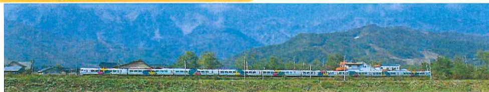
列車を利用して地質と地形を楽しむジオ鉄の旅。JR大糸線の沿線に広がる大地の歴史と魅力をお話します。